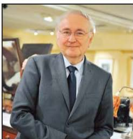
« La loi nous autorise à bloquer les prix pendant six mois et il faut le faire », rapporte le candidat de Solidarité et Progrès.

Il a aussi, ce sont seulement des questions financières qui m'ont empêché de m'y rendre. Vous ne le savez sans doute pas : les seuls fonds disponibles pour faire une présidentielle doivent venir de : 1) la fortune personnelle du candidat ; 2) des dons de personnes physiques ; 3) des dons de personnes physiques ; 4) des prêts des banques et du parti Solidarité et Progrès à la campagne. Je n'ai pas de fortune personnelle, et pour ce qui est des banques, elles ne se pressent pas aux portillons surtout quand