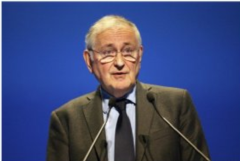
Jacques Cheminade en mai 2007

En 1995, Jacques Cheminade était déjà candidat à la présidentielle. Mais l'histoire avait mal tourné pour lui. Ses comptes de campagne avaient été invalidés par le Conseil constitutionnel, qui fermait les yeux sur les irrégularités de Chirac et Balladur. 17 ans plus tard, il traîne encore sa grosse prune et crie à l'injustice.